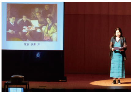
「無言館」戦没画学生の絵に寄せての朗読