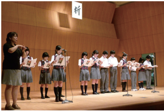
青山中学校生徒達