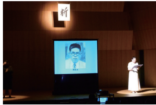
「無言館」戦没画学生