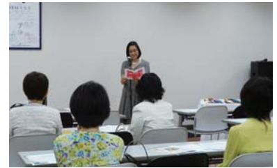
ヒルズサロン朗読会