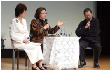
チャリティー朗読会