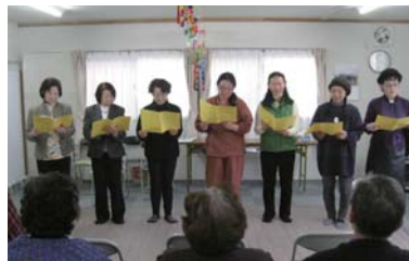
宮古のボランティア活動