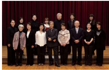
プランタン朗読会