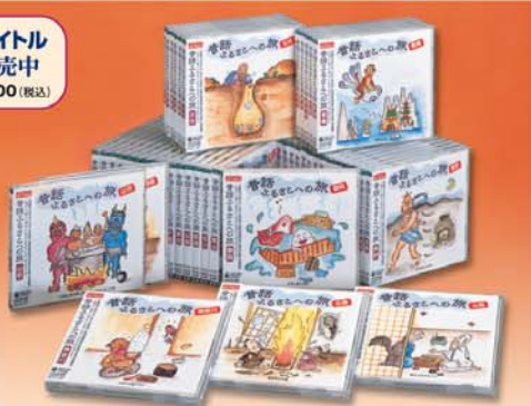
(CD全47タイトル) ■KICG-3181~3227 ジャケット表紙絵: 鈴木ひろえ