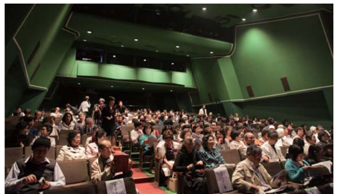
2011年第9回「朗読の日」会場の様子